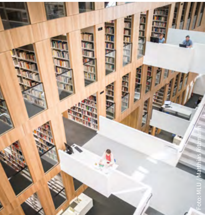
Moderne Bibliothek auf dem Steintor-Campus