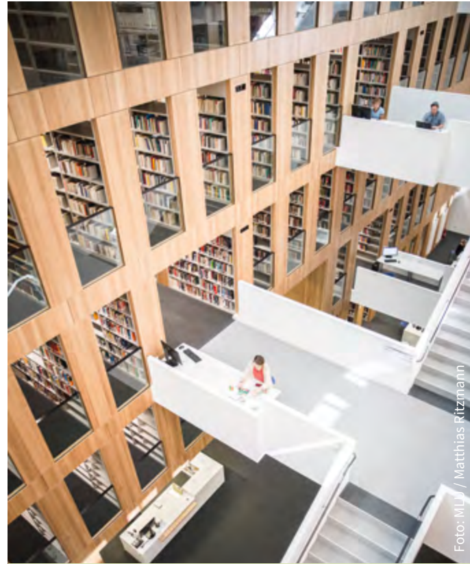
Bibliothek am Steintor-Campus