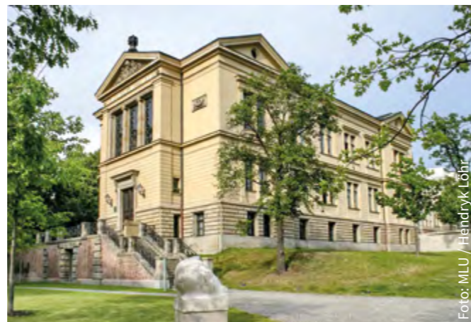
Robertinum am Universitätsplatz

ASQ → Zu den Allgemeinen Schlüsselqualifikationen zählen Präsentations- und Fremdsprachenkenntnisse sowie schriftliche, mündliche, soziale und interkulturelle Kompetenzen. Diese sollen den späteren Berufseinstieg unterstützen. Empfohlen für den Bachelor Klassisches Altertum werden insbesondere die Fremdsprachen Französisch und Italienisch.