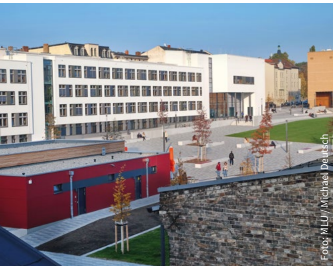
Blick über den Steintor-Campus

Bei Soziologie 60 LP wird die Art des Abschlusses vom anderen Teilstudiengang (120 LP) bestimmt.