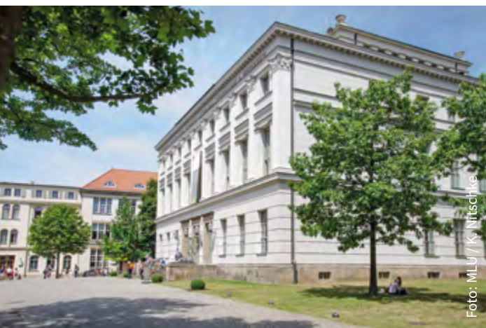
Löwengebäude auf dem Universitätsplatz