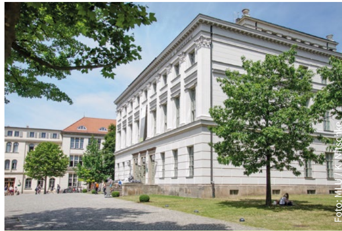
Löwengebäude auf dem Universitätsplatz