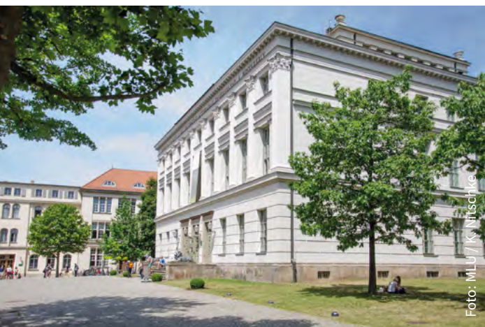
Löwengebäude auf dem Universitätsplatz