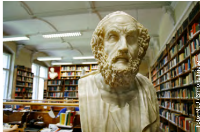
Zweigbibliothek der Klassischen Altertumswissenschaften