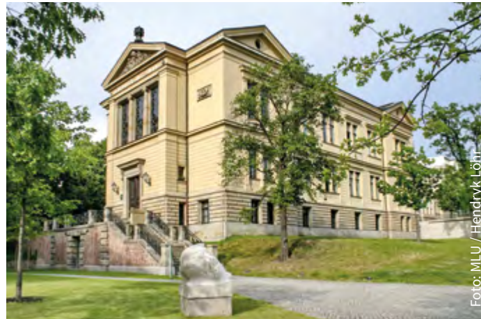
Robertinum am Universitätsplatz