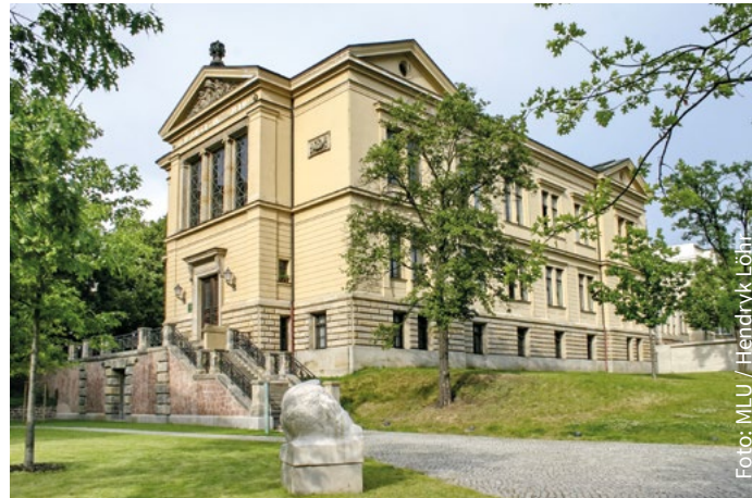
Robertinum am Universitätsplatz