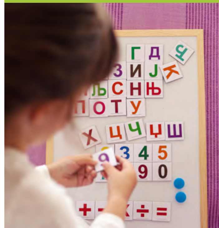
Stand: März 2020 | Foto: krsmanovic, stock.adobe.com

Gymnasium Sekundarschule Förderschule (Sekundarschulfach)