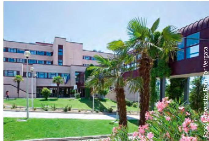
Universität Rom Tor Vergata