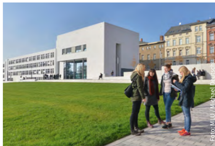
Studieren am modernen Steintor-Campus