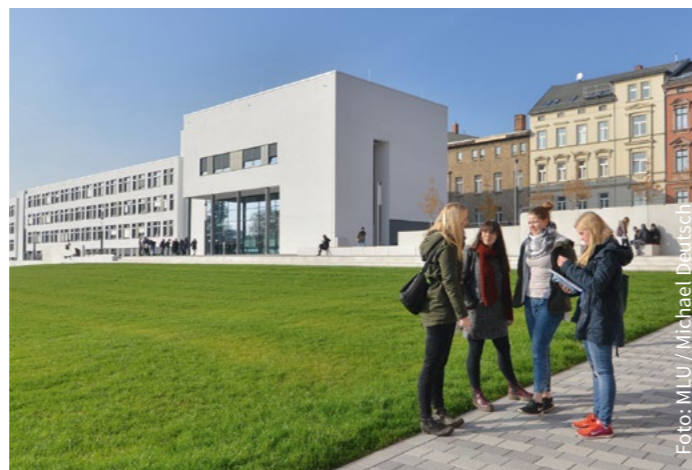
Studieren am modernen Steintor-Campus