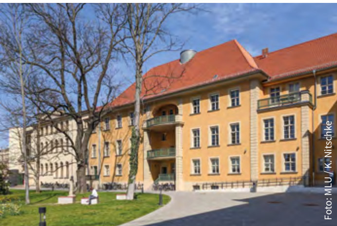
Institut für Romanistik auf dem Steintor-Campus