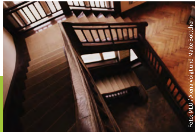
Orientalisches Institut im Mühlweg 15