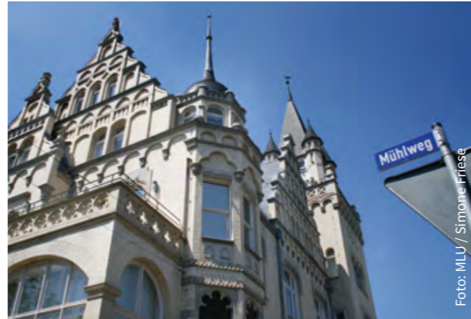
Orientalisches Institut im Mühlweg 15

Hinzu kommt die seit 1848 bestehende Bibliothek der Deutschen Morgenländischen Gesellschaft. Das Institut ist Teil eines spezialisierten Umfelds von Forschungseinrichtungen mit Orientbezug wie z.B. die Franckeschen Stiftungen, das Zentrum für Interdisziplinäre Regionalstudien und das Max-Planck-Institut für ethnologische Forschung.