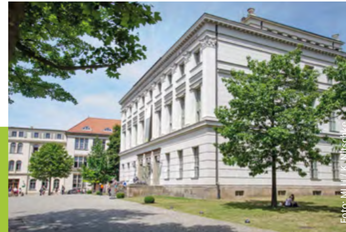
Löwengebäude auf dem Universitätsplatz

→ www.uni-halle.de/studienberatung → www.uni-halle.de/studienangebot