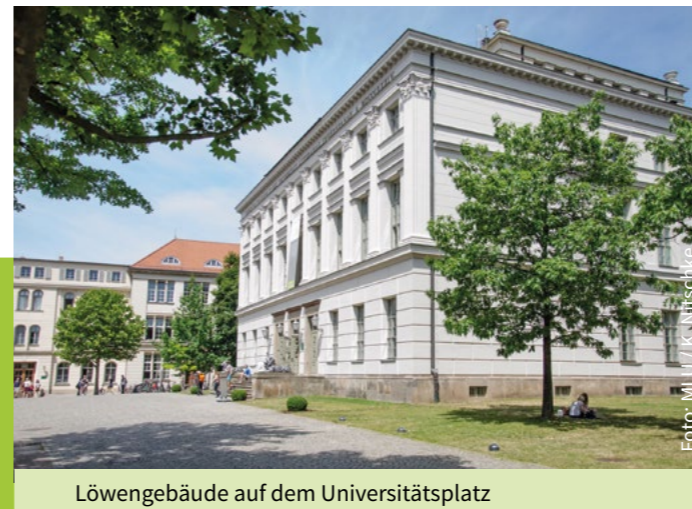
Löwengebäude auf dem Universitätsplatz