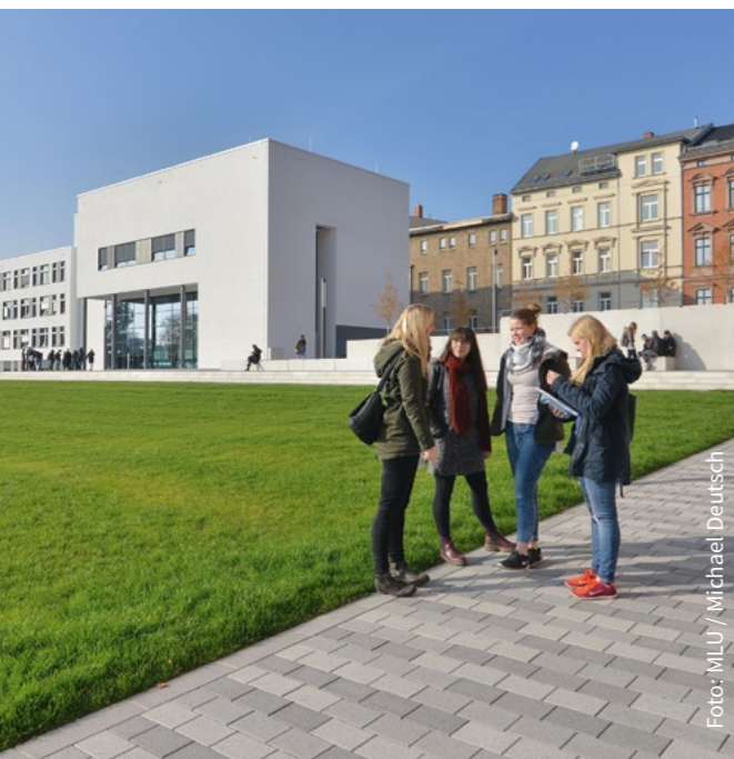
Studieren am Steintor-Campus

Zur Erweiterung der Erfahrungen ist ein Auslandsaufenthalt empfehlenswert. Neben der Vertiefung der sprachlichen Fertigkeiten kann die interkulturelle Kompetenz entwickelt werden. Kontakte der Halleschen Slavistik bestehen zu verschiedenen Hochschulen in Polen, Russland und den Ländern des Balkans.