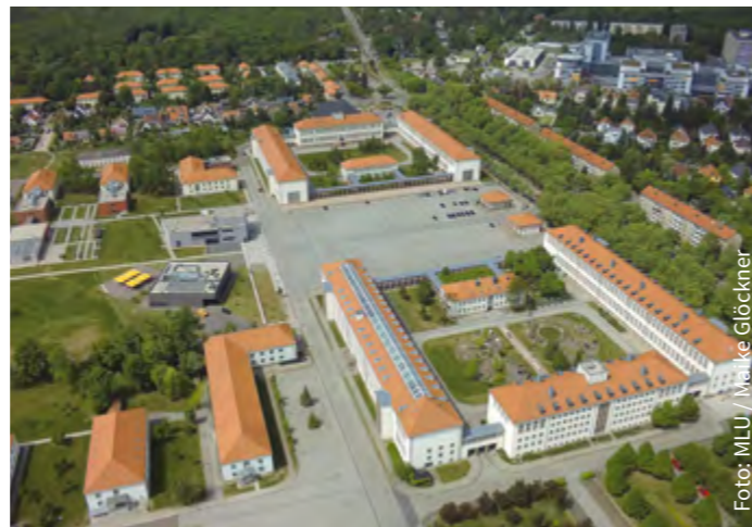
Studieren am modernen Campus Heide-Süd

Ausführliche Informationen entnehmen Sie bitte der Webseite zum Studiengang ( www.uni-halle.de/studienangebot → Fach) und der gültigen Studien- und Prüfungsordnung. Über die Erfüllung der Zulassungsvoraussetzungen entscheidet in Zweifelsfällen der Studien- und Prüfungsausschuss.