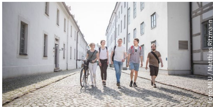
Lehramt studieren in den Franckeschen Stiftungen